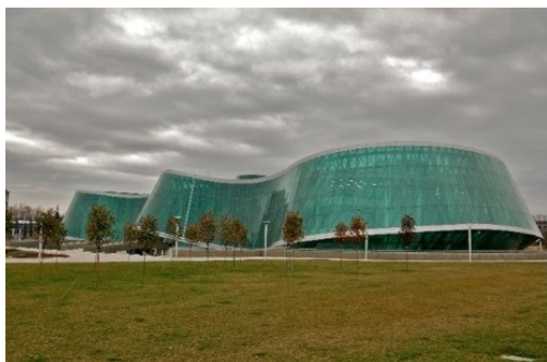
3. Le ministère géorgien de l'Intérieur, Tbilissi (L.-A. Le Moulec, 2010).

La Géorgie est devenue un eldorado pour les architectes. A condition qu'ils soient les élus du cœur de Micha. Parmi ceux-ci, l'Italien Michele de Lucchi, concepteur de ce fameux ministère transparent, mais aussi du Palais présidentiel ou encore du pont de la Paix, inauguré en avril 2010 à Tbilissi. Dans les échoppes de l'ancienne Tiflis, la critique va bon train sur les projets de l'hyper-président. Le palais a été renommé « couille de Micha », et le pont de verre, « Always ultra » en référence à la fameuse serviette hygiénique.