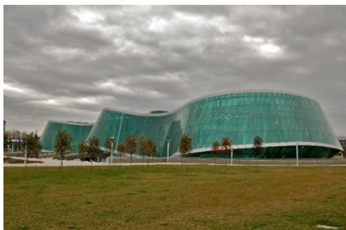
3. Le ministère géorgien de l'Intérieur, Tbilissi.

La Géorgie est devenue un eldorado pour les architectes. A condition qu'ils soient les élus du cœur de Micha. Parmi ceux-ci, l'Italien Michele de Lucchi, concepteur de ce fameux ministère transparent, mais aussi du Palais présidentiel ou encore du pont de la Paix, inauguré en avril 2010 à Tbilissi. Dans les échoppes de l'ancienne Tiflis, la critique va bon train sur les projets de l'hyper-président. Le palais a été renommé « couille de Micha », et le pont de verre, « Always ultra » en référence à la fameuse serviette hygiénique.