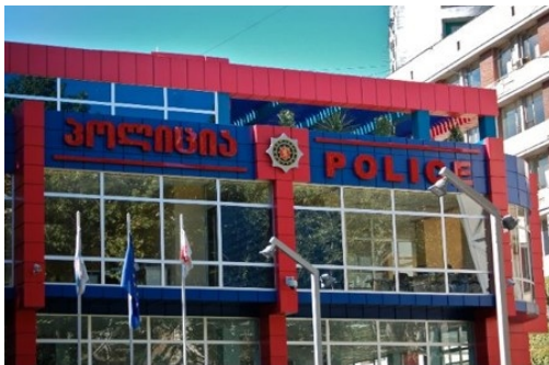
2. Commissariat de quartier, Sarbutalo Tbilissi (L.-A. Le Moulec, 2010).

Parallèlement à la spectaculaire réforme de la Milice transformée en Police en 2006, après la révocation de l'ensemble des forces de l'ordre et de sécurité, des commissariats de verre ont vu le jour jusqu'au fin fond des vallées les plus reculées. Symbole de ce régime nouveau, moderne et juste, qui fait table rase du passé et des privilèges octroyés aux serviteurs de l'Etat, le verre habille l'ensemble des bâtiments officiels.