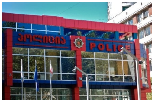
2. Commissariat de quartier, Sarbutalo Tbilissi (L.-A. Le Moulec, 2010).

Parallèlement à la spectaculaire réforme de la Milice transformée en Police en 2006, après la révocation de l'ensemble des forces de l'ordre et de sécurité, des commissariats de verre ont vu le jour jusqu'au fin fond des vallées les plus reculées. Symbole de ce régime nouveau, moderne et juste, qui fait table rase du passé et des privilèges octroyés aux serviteurs de l'Etat, le verre habille l'ensemble des bâtiments officiels.