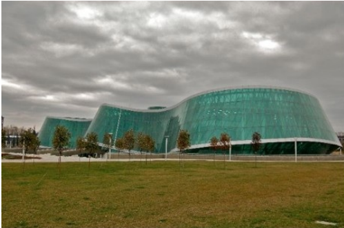
3. Le ministère géorgien de l'Intérieur, Tbilissi (L.-A. Le Moulec, 2010).

Après le palais présidentiel, autre bâtiment visible dans la capitale, le ministère de l'Intérieur. Achevé en 2009, il est judicieusement placé sur le côté de l'avenue Georges Bush qui mène à l'aéroport, passage obligé des délégations internationales.