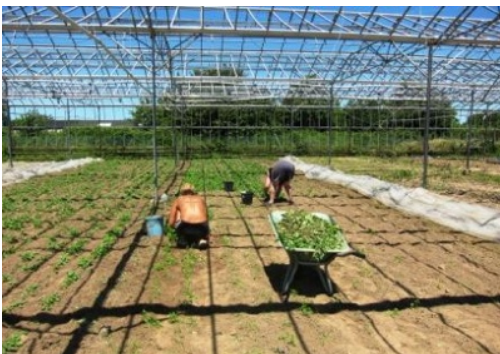
Sievietes str?d? siltumn?c?s. (G?rnsija, 2011. g. j?lij?)

Strauj? migrantu main?ba G?rnsij? var tikt raksturota k? past?v?ga nepast?v?ba. Respondenti parasti uzsver, ka G?rnsij? ir „tikai uz laiku,” pat, ja p?rvietošan?s starp Latviju un šo salu ilgst jau vair?k nek? desmit gadu. Individu?li migranti atk?rtoti iebrauc G?rnsij? un izbrauc no t?s – p?rsvar? uz Latviju, bet reiz?m ar? uz cit?m Eiropas valst?m, lai atkal atgrieztos G?rnsij?. No salas aizbraukušo viet? ierodas jauni, kas Latvijas iedz?vot?ju k? kopienas kl?tb?tni padara relat?vi past?v?gu. Lai ar? liel?kaj? da?? interviju ir atsauces uz pazemojošiem darba apst?k?iem, vismaz migr?cijas pirmajos gados – dz?vojot vien? istab? asto?iem cilv?kiem, str?d?jot teju bez nevienas br?vas dienas devi?us m?nešus –, šo pieredzi indiv?di portret? dr?z?k k? eksotisku, uzsverot, ka „ atš?ir?b? no citiem latviešiem, man gan paveic?s! ”, person?go veiksmi pretstatot kopienas pieredzei.