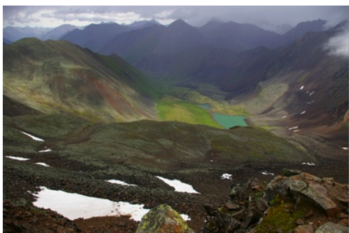
4. Vue du col Choumak © Olga den Besten.

Une entreprise privée aurait loué le territoire de Choumak à l'État pour le développer comme zone touristique. Ce projet inquiète les habitués des lieux : la commercialisation de cette station jusqu'ici « sauvage », détériorera-t-elle la nature environnante ? Pour l'instant, le développement a apporté des améliorations : l'entreprise a établi une connexion régulière avec Irkoutsk par hélicoptère, ce qui sert surtout en cas d'urgence, et a organisé la collecte des déchets produits par l'activité humaine, évacués dans les décharges d'Irkoutsk.