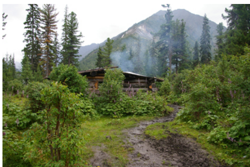
2. « Zimovie » à Choumak © Olga den Besten.

Les malades soignés à Choumak laissent par gratitude divers ex-voto près de la source d'eau qui les a soignés: par exemple, des pièces de monnaies et des petites sculptures en bois, qu'ils ont fabriquées eux-mêmes pendant leur séjour. Chaque source est réputée guérir un mal spécifique, comme les maladies des yeux ou des reins. Cette source-là est réputée guérir la stérilité.