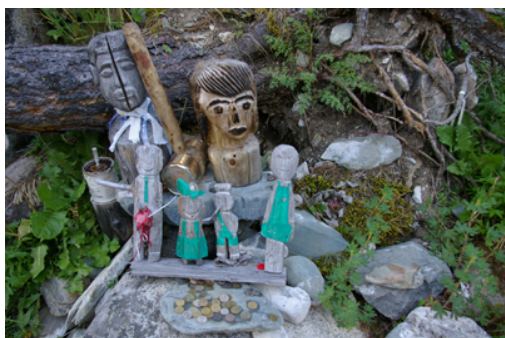
1. La source de la fertilité © Olga den Besten.

Les malades soignés à Choumak laissent par gratitude divers ex-voto près de la source d'eau qui les a soignés: par exemple, des pièces de monnaies et des petites sculptures en bois, qu'ils ont fabriquées eux-mêmes pendant leur séjour. Chaque source est réputée guérir un mal spécifique, comme les maladies des yeux ou des reins. Cette source-là est réputée guérir la stérilité.