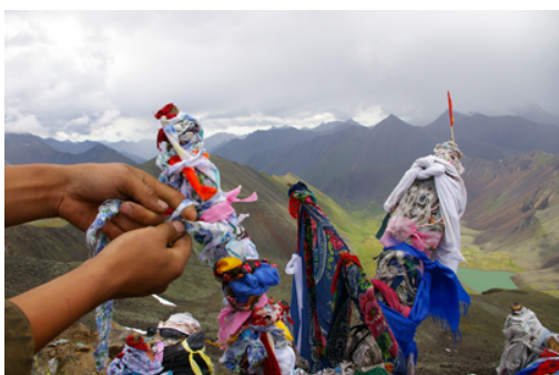
5. « Obo » sur le col © Olga den Besten.

Depuis la ville d'Oulan-Oude, capitale de la Bouriatie, le bus parcourt 500 km pour arriver au terme d'une journée au pied des Monts Saïan. Là commence l'ascension vers les montagnes... Deux jours, sac au dos, dans des paysages variés, d'une beauté époustouflante : d'abord, la taïga avec ses marais et ses petits lacs, puis les rochers et les vallées aux prairies alpestres jonchées de fleurs.