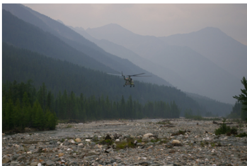
3. Hélicoptère en provenance d'Irkoutsk en train d'atterrir près de Choumak.

Une entreprise privée aurait loué le territoire de Choumak à l'État pour le développer comme zone touristique. Ce projet inquiète les habitués des lieux : la commercialisation de cette station jusqu'ici « sauvage », détériorera-t-elle la nature environnante ? Pour l'instant, le développement a apporté des améliorations : l'entreprise a établi une connexion régulière avec Irkoutsk par hélicoptère, ce qui sert surtout en cas d'urgence, et a organisé la collecte des déchets produits par l'activité humaine, évacués dans les décharges d'Irkoutsk.