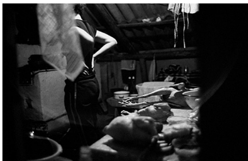
Préparation d'un mariage traditionnel à leud dans les Maramures.

Photographe autodidacte, Bruno Cogez s'installe à Bucarest entre 1999 et 2004. A partir de 2001, il réalise le documentaire photographique « Les juifs de Roumanie », fruit d'un travail de deux années, durant lesquelles il s'immerge dans le quotidien des membres de la communauté juive de Roumanie. Fasciné par la transition en Europe de l'Est, ses voyages le conduisent à travers toute l'Europe centrale. Ses nombreux reportages sont publiés dans la presse occidentale.