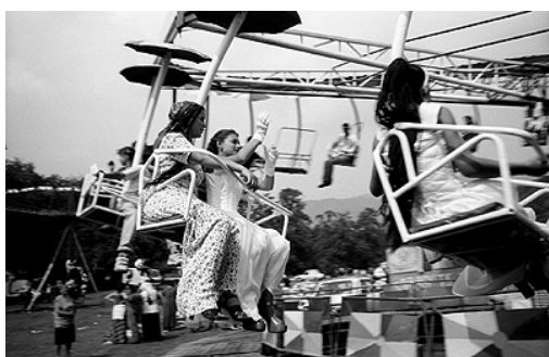
Festival tsigane de Costesti.

Photographe autodidacte, Bruno Cogez s'installe à Bucarest entre 1999 et 2004. A partir de 2001, il réalise le documentaire photographique « Les juifs de Roumanie », fruit d'un travail de deux années, durant lesquelles il s'immerge dans le quotidien des membres de la communauté juive de Roumanie. Fasciné par la transition en Europe de l'Est, ses voyages le conduisent à travers toute l'Europe centrale. Ses nombreux reportages sont publiés dans la presse occidentale.