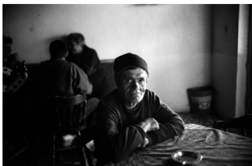
Pêcheur lipovène au bistro de Mila 23 dans le delta du Danube lors de la période d'interdiction de la pêche.

photographie sociale et documentaire en 2003 et 2006. Directeur du Collectif EST depuis 2004, Bruno Cogez fait aujourd'hui la promotion des photographes et de la photographie de l'Europe de l'Est.