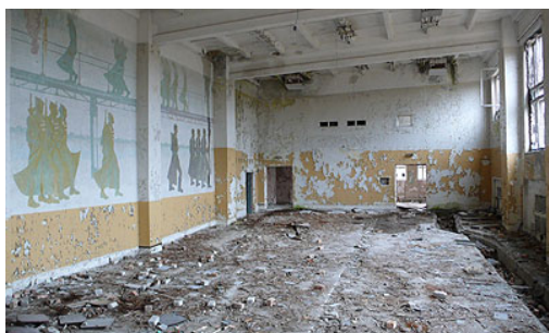
4. Irbene – Salle des fêtes

Lovée dans la forêt à 3 kilomètres de la mer, Irbene est aujourd'hui une ville fantôme, pillée et saccagée, selon les sources, par les derniers habitants sur le départ ou par les premiers squatteurs, puis dégradée par le climat maritime et froid de la région. De grands immeubles abandonnés en brique blanche ou en préfabriqué entourent une poignée d'équipements (gymnase, salle des fêtes, restaurant) partiellement effondrés et à peine reconnaissables.