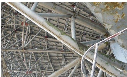
5. Irbene – l'antenne RT-32

«Découverte» par les autorités lettones sur les cartes d'Etat major en 1993 alors qu'elle n'existait déjà presque plus, la ville est aujourd'hui à l'abandon et ne figure toujours pas sur les cartes.