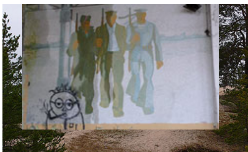
1. Irbene - L'antenne RT-32

Dans le Nord de la Courlande, à 150 km de Riga, se dresse au-dessus de la cime des pins de la côte livonienne un radiotélescope géant d'une cinquantaine de mètres de haut.