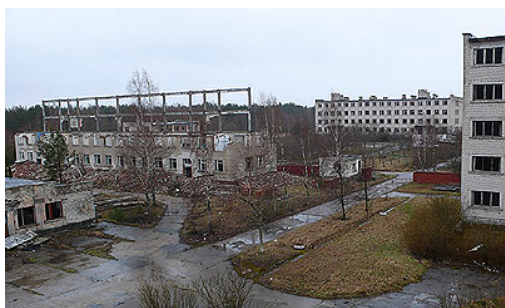
2. Irbene - La ville abandonnée

Le 22 juillet 1994, le dernier soldat russe quittait Irbene et les antennes étaient investies par l'Académie des Sciences de Lettonie.