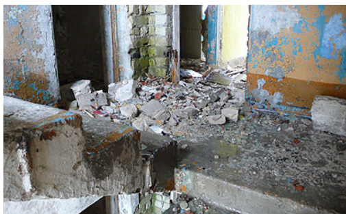
3. Irbene – Immeuble d'habitation

Lovée dans la forêt à 3 kilomètres de la mer, Irbene est aujourd'hui une ville fantôme, pillée et saccagée, selon les sources, par les derniers habitants sur le départ ou par les premiers squatteurs, puis dégradée par le climat maritime et froid de la région. De grands immeubles abandonnés en brique blanche ou en préfabriqué entourent une poignée d'équipements (gymnase, salle des fêtes, restaurant) partiellement effondrés et à peine reconnaissables.