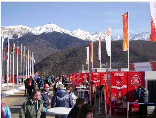
1. Restauration rapide au pied des montagnes

L'Ukraine s'ouvrait alors déjà de la mainmise de la Russie mais Vladimir Poutine semblait encore hésiter à la retenir. Les Russes, eux, ignoraient que, dès le lendemain de la fête, ils allaient se trouver une nouvelle fois confrontés à l'Occident. C'est ce dernier instant de paix et d'internationalisme à la russe, jusque dans l'assiette, qui est présent à travers ce reportage photographique.