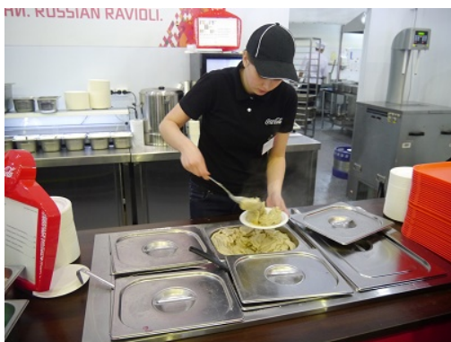
3. Stand de pelmeni

symboles les plus parlants (samovar g ant et chapka compris), et cela jusque dans les fast-foods.