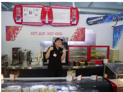
4. Stand de hotdogs

L'occasion fut saisie pour promouvoir la cuisine russe aupr s des milliers de personnes pr sentes. Dans le but de faciliter pour les  trangers cette rencontre gustative, rien de plus efficace que quelques raccourcis culinaires: les pelmeni se rapprocheraient des ravioli et le chachlik aurait comme un air de barbecue.