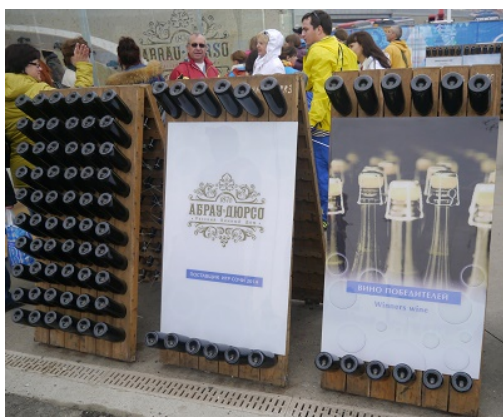
5. Stand de la maison viticole Abrau Durso

Pour souligner la dimension internationale de lâ vivement, la moiti  des stands proposaient de l'alimentation rapide: hotdogs, donuts, panini et pizza  taient au rendez-vous. Quelques surprises culinaires attendaient les spectateurs des JO, telles les « baked potatoes »   la sauce bolognaise.