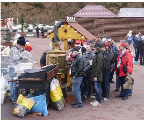
2. Un stand de restauration rapide à Roza Khoutor

Pour la cérémonie d'ouverture des JO, la Russie a remis à l'honneur le folklore et ses