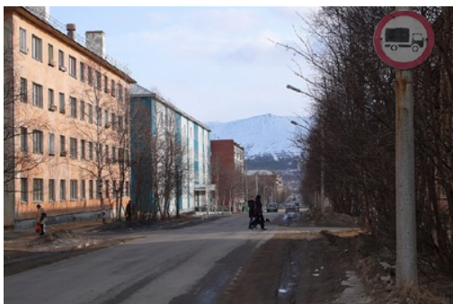
Centre ville de Montchegorsk

Mais Montchegorsk, c'est aussi un espace urbain. Un premier campement est installé en 1935 sur les berges du lac Imandra, puis une ville est tracée au cordeau sur la presqu'île, entre débarcadère et usine, selon les plans de l'architecte Leningradois, Brovtsev. En 1936, on perce à travers la forêt le grand axe de la ville, l'avenue Jdanov, bientôt renommée avenue des Métallurgistes. Les premiers immeubles sont construits en 1938.