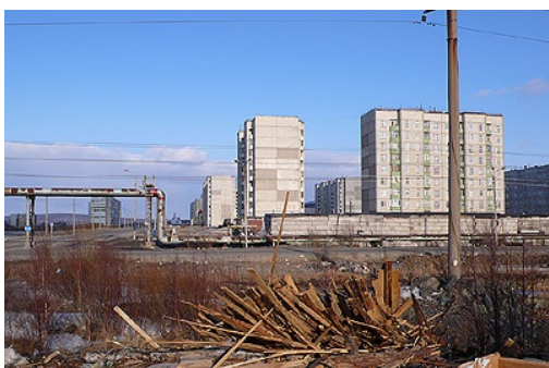
Le quartier de Montcha

Mais Montchegorsk, c'est aussi un espace urbain. Un premier campement est installé en 1935 sur les berges du lac Imandra, puis une ville est tracée au cordeau sur la presqu'île, entre débarcadère et usine, selon les plans de l'architecte Leningradois, Brovtsev. En 1936, on perce à travers la forêt le grand axe de la ville, l'avenue Jdanov, bientôt renommée avenue des Métallurgistes. Les premiers immeubles sont construits en 1938.