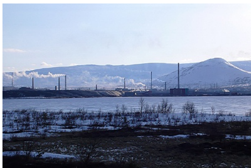
Le lac Nioud, le combinat, le mont Nittis et la Toundra de Montche

Montchegorsk, c'est aussi la porte de la plus grande réserve naturelle ( zapovednik ) de l'oblast de Mourmansk, qui s'étend derrière la ligne de crête de la Toundra de Montche sur 3.000 km 2 . Sa création, en 1930, a même précédé celle de la ville et du combinat... Néanmoins, la proximité immédiate de l'usine et son extension dans les années 1980 ont conduit la réserve à céder du terrain pour s'étendre davantage vers l'ouest. C'est une réserve mondiale de biosphère depuis 1984.