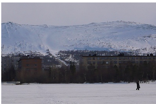
Le lac Komsomolskoe et le mont Nioud

Montcha est le quartier construit sur les bords du lac Nioud, face au combinat.