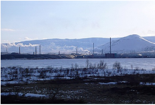
Le lac Nioud, le combinat, le mont Nittis et la Toundra de Montche

kilomètres, qui attire même des Pétersbourgeois en week-end prolongé.