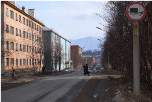
Centre ville de Montchegorsk (  Eric Le Bourhis 2008)

mini re et m tallurgique de Kola) et filiale de Norilsk Nickel,  tait en grande partie aliment e par le minerai extrait   Norilsk en Sib rie centrale, puis achemin e par la Route maritime du Nord, de Doudinka   Mourmansk. C est l une des usines les plus polluantes au monde (dioxyde de soufre), qui fait encore parler d elle aujourd hui pour les dommages caus s   la for t environnante et les alertes lanc es   la population lorsque le vent ram ne les fum es vers la ville (les premiers immeubles ne sont situ s qu    deux kilom tres du combinat).