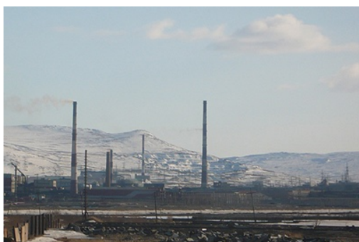
Le combinat métallurgique et les mines à ciel ouvert

Montchegorsk, c'est avant tout une mine de nickel et de cuivre creusée dans la montagne et un combinat métallurgique construit par des prisonniers du goulag durant le deuxième plan quinquennal de l'Union soviétique et entré en activité en 1939. En effet, la presqu'île de Kola est un lieu de déportation précoce dans le Grand Nord russe: environ 250.000 personnes y seront déportées au cours des années 1930, tandis que le NKVD et le Parti de Leningrad (dirigée par Jdanov à partir de 1934) prendront en main l'industrialisation de la région.