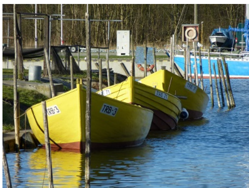
1. Embarcations traditionnelles de la lagune, au port de Trzebie?.