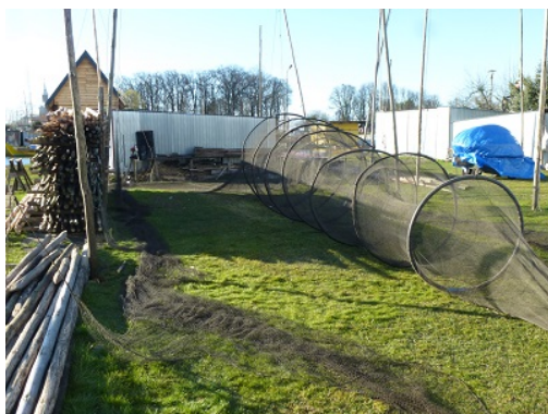
2. Verveux à ailes (filet fonctionnant comme un entonnoir, planté dans la vase des bas fonds), étendu pour le séchage et le ramendage et pieux en châtaigniers, port de Trzebie?.