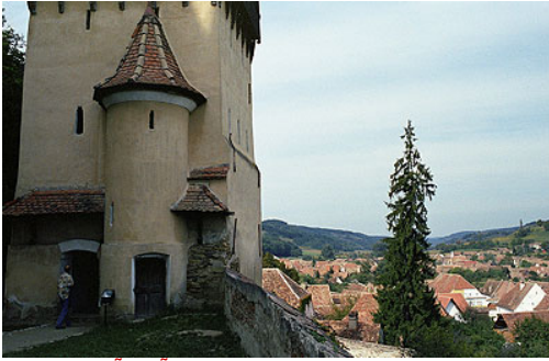
Citadelle médiévale de Biertan. Elle fut pendant trois siècles le siège épiscopale de l'Église évangélique des Allemands de Roumanie.

Un fort sentiment d'appartenance communautaire anime encore les Saxons de Transylvanie, comme on peut le constater lors du rassemblement annuel de Biertan, un village typique situé à une cinquantaine de kilomètres de Sibiu. Leur langue, issue de l'actuel Luxembourg, dont beaucoup d'entre eux sont originaires, continue d'être couramment pratiquée. En Transylvanie, subsistent des villages saxons à l'architecture caractéristique, dont plusieurs sont classés au patrimoine architectural de l'UNESCO. Enfin, leur pratique religieuse se perpétue autour de l'Église évangélique des saxons.