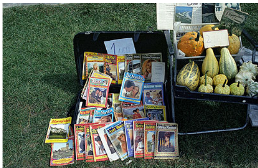
Lors du rassemblement de Biertan, rassemblement des Saxons de Roumanie, de vieilles revues en allemand datant des années soixante, sont vendues par des particuliers