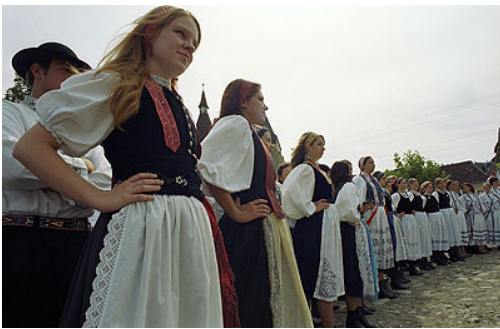
Groupes folkloriques saxons, lors d'une animation à l'occasion de la rencontre des Saxons à Biertan. Chaque ville de Transylvanie possède un groupe. Les costumes des hommes sont identiques, seuls les costumes féminins connaissent des variantes.

Un fort sentiment d'appartenance communautaire anime encore les Saxons de Transylvanie, comme on peut le constater lors du rassemblement annuel de Biertan, un village typique situé à une cinquantaine de kilomètres de Sibiu. Leur langue, issue de l'actuel Luxembourg, dont beaucoup d'entre eux sont originaires, continue d'être couramment pratiquée. En Transylvanie, subsistent des villages saxons à l'architecture caractéristique, dont plusieurs sont classés au patrimoine architectural de l'UNESCO. Enfin, leur pratique religieuse se perpétue autour de l'Église évangélique des saxons.