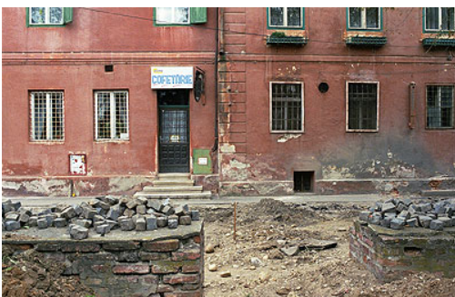
Rue en travaux dans le centre ancien de Sibiu. Un très vaste programme de rénovation historique a été mis en oeuvre. Une très grande partie des rues du centre historique sont aujourd'hui en rénovation. On estime que les travaux devraient se poursuivre encore plusieurs années

Il entend mettre à profit cette situation pour faire de sa ville une tête de pont de la Roumanie vers l'Europe.