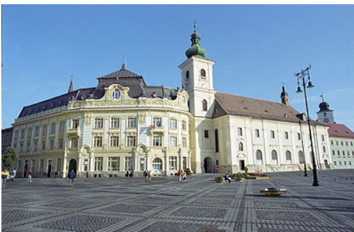
La grande place, piata mare, place centrale du centre historique de Sibiu sur laquelle se trouvent la mairie et l'Ã©glise orthodoxe. La rÃ©novation rÃ©cente en fait un des lieux les mieux conservÃ©s de Roumanie.

La migration des Saxons vers la Roumanie, toujours dans le cadre d'Ã©changes bilatÃ©raux, a connu plusieurs vagues, dont les premiÃ¨res datent du 13Ã¨me siÃ©cle, pour repousser les Tatars, et les derniÃ¨res de lâempire austro-hongrois.