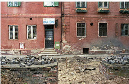
Rue en travaux dans le centre ancien de Sibiu. Un très vaste programme de rénovation historique a été mis en oeuvre. Une très grande partie des rues du centre historique sont aujourd'hui en rénovation. On estime que les travaux devraient se poursuivre encore plusieurs années

Il entend mettre à profit cette situation pour faire de sa ville une tête de pont de la Roumanie vers l'Europe.