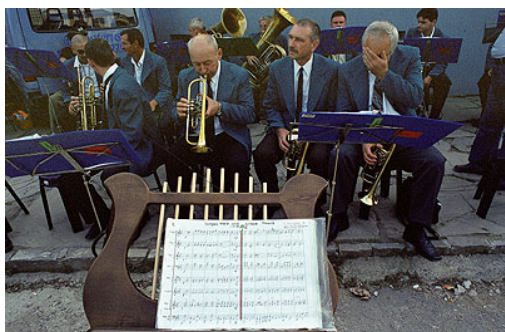
La fanfare de l'association des Saxons de Sibiu compte dans ses rangs autant d'Allemands que de Magyars. La communauté allemande a toujours été considérée comme une communauté fédératrice vis à vis des autres composantes de la société roumaine