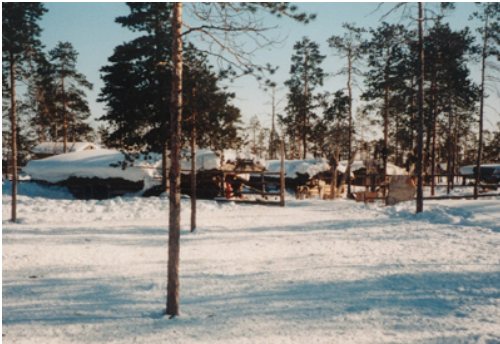
Campement sur la Tiouïtiaha (région de l'Agan), Photo Eva Toulouze, 1999.

Il semble bien donc que la dimension linguistique ne joue qu'un rôle minime dans la conscience identitaire des Nenets des forêts.