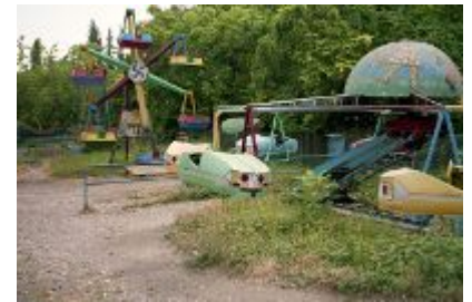
Parc d'attraction à Stepanakert

Toutes les photographies ont été prises par l'auteur en août 2007.