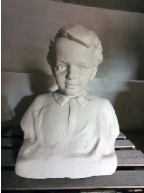
La Béline enfant (œuvre de

Le mémorial Béla Kun, inauguré en 1986 pour le 100 ème anniversaire de la naissance du leader politique, dirigeant du 1 er régime communiste de Hongrie, symbole de la révolution stalinienne et réhabilité