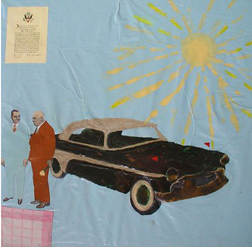
Raul Rajangu. 1955.a Plymouth and the sun – 1981

soviétique pour en faire un patchwork du réel qui n'est pas sans rappeler l'œuvre de l'artiste argentin des années 1960-1970 Antonio Berni, ou les paysages urbains du peintre polonais Edward Dwurnik. L'artiste regarde le monde avec des yeux d'enfant, comme dans 1955.a Plymouth and the sun (1981) ou Awe of a Bank (2002). Il s'inscrit à l'intérieur de ses tableaux et se moque de la compréhension de ceux-ci.