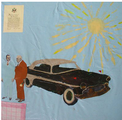
Raul Rajangu. 1955.a Plymouth and the sun - 1981