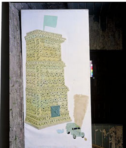
Raul Rajangu. On a White Night in the Kadriorg Castle – 1987