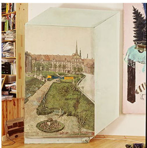
Raul Rajangu. Awe of a Bank - 2002