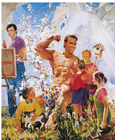
Vinogradov Dubossarsky. En plein Air – 1995.

Usant de la dérision, de l'absurdité ou du cynisme, l'art des peintres russes Alexander Vinogradov et Vladimir Dubossarsky nous entraîne, avec légèreté, feu de couleurs et esprit baroque, dans un monde onirique et idyllique à cent lieues, à première vue, du chaos régnant dans les rues. Amusante et cocasse, En Plein Air (1995) traduit ici une satire et une critique de la réalité ; l'image qui peut «transpirer» du personnage d'Arnold Schwarzenegger (transposition du héros légendaire de l'antiquité) est celle d'un monde de la fiction et de l'imaginaire brouillant celui de la représentation et mettant en péril celui de la réalité.