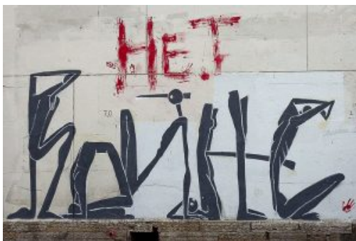
Non à la guerre - Vlada MV Pictures

Cette effervescence a été favorisée par une politique d'État relativement tolérante : à l'époque, le pouvoir se concentrait sur d'autres priorités, laissant le street art dans une forme d'angle mort bienveillant. M. Oger explique qu'il était alors possible de travailler de manière transparente avec les autorités, qui cherchaient à promouvoir la culture, tout en menant en parallèle des projets beaucoup plus radicaux, comme l'exposition dédiée à Oleg Navalny (frère de l'opposant russe Alexeï Navalny) (1) . Ce grand écart entre soutien institutionnel et engagement politique était alors l'essence