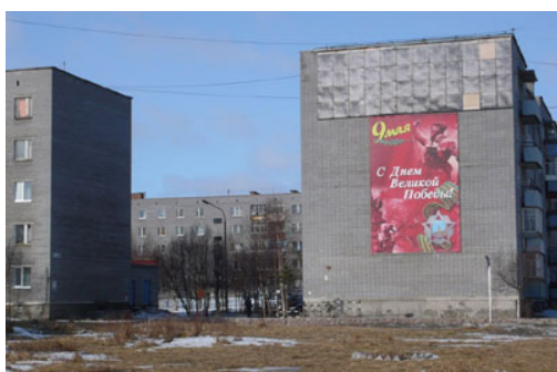
1. Le 9 mai à Olenegorsk

Cette combinaison bicolore semble avoir désormais pris valeur de tradition en Russie, ornant cartes postales et affiches officielles. C'est elle que l'on retrouve sur les grands formats qui ornent les murs et les panneaux publicitaires au moment des commémorations.