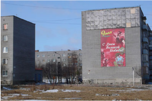
1. Le 9 mai à Olenegorsk

La reprise, aujourd'hui «vulgarisée» et quelque peu détournée, d'une décoration militaire a été, d'après les organisateurs, préalablement largement discutée avec les vétérans: la réplique du ruban a été adaptée en largeur et en longueur à ses nouvelles fonctionnalités.