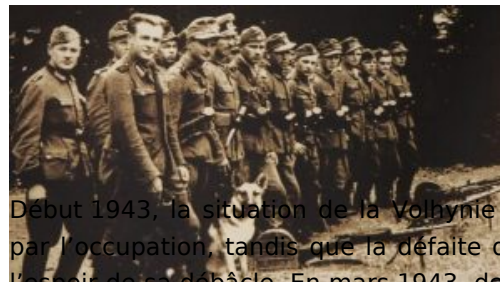
Soldats de l'UPA en Galicie, en 1944.

La Galicie orientale et la Volhynie subissent les occupations allemande et soviétique à partir de 1939. Administrée par l'Allemagne nazie dès 1941, la Volhynie connaît une situation particulièrement difficile. Appauvries par les privations, les populations polono-ukrainiennes sont témoins mais aussi parfois complices des massacres de juifs. Les nationalistes ukrainiens réunis au sein du groupe « OUN-B » considèrent l'URSS comme leur principal ennemi et tentent d'abord de collaborer avec l'Allemagne, avant d'entrer en résistance.